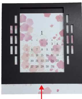
本来の正しいセット状態