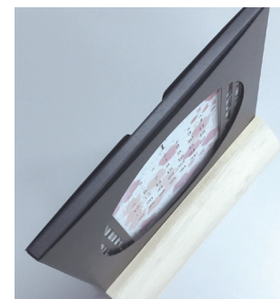
カレンダーを上から見た図

3. 上部から、カレンダーの断面がカバーで隠れていればOKです。下部分を木のスタンドに差し込んでください。